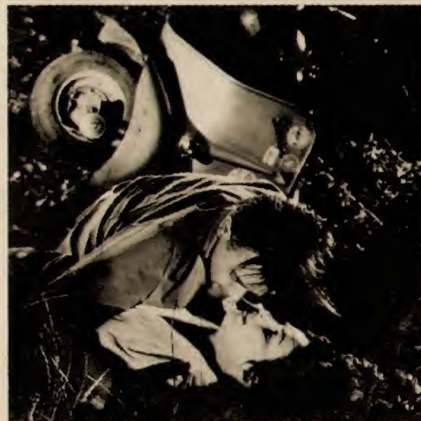
Das hätte schlimm ausgehen können! Wenn man verliebt ist, geht man besser zu Fuß.